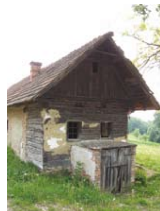
Cimprana hiša v Čagoni