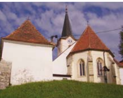
Cerkev Sv. Antona Puščavnika

Številnih cerkva na Slovenskem, v Avstriji in na Hrvaškem. S portreti in tihožitji je po 1. svetovni vojni uspešno sodeloval na umetnostnih razstavah v Mariboru.