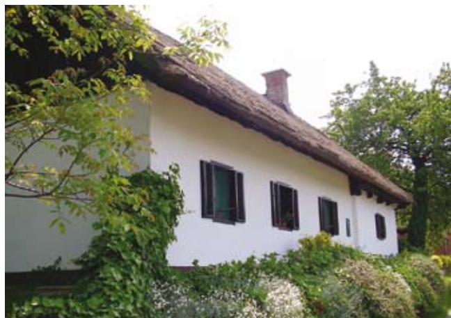
S slamo krita cimprana hiša v Peščenem Vrhu

Območje Cerkvenjaških goric je bilo že od nekdaj zanimivo za poselitev, o tem nam pričajo arheološki ostanki, odkriti na tem območju. Najdenih je bilo sedem kamnitih orodij iz mlajše kamene dobe pred 4000 in več leti. Iz tega obdobja izvira tudi lepo ohranjeno ognjišče, odkrito v Andrencih, okoli katerega so ležali razni predmeti, več