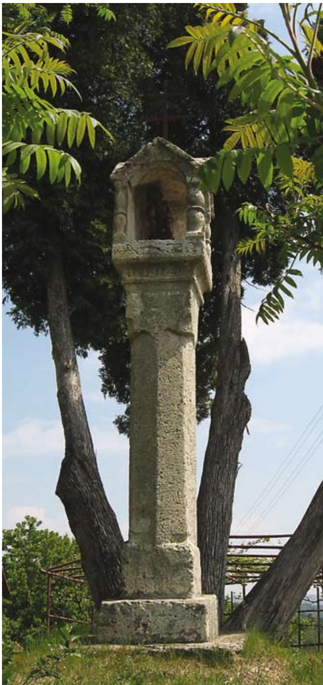
Kužno znamenje iz 16.stol. v Cogetincih

Občina Cerkvenjak leži v osrednjih Slovenskih goricah, na križišču cest proti Ptuj, Mariboru in Gornji Radgoni. Občina meri 24,5 kvadratnih kilometrov in ima okoli 2200 prebivalcev. Središče občine je Cerkvenjak, razloženo naselje z gručastim jedrom na slemenu, kjer stoji župnijska cerkev sv. Antona Puščavnika. Naselje v svojem jedru kaže urbani videz, tu je nekaj storitvenih dejavnosti za bližnjo okolico. Staro ime naselja so zamenjali za svetniško šele leta 1907, ime Cerkvenjak so kraju vrnili leta 1952. Za šaljiv grb ima Cerkvenjak klobuk s peresom.