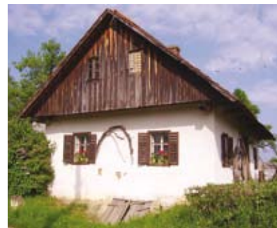
Cimprana hiša v Brengovi

Občina Cerkvenjak leži v osrednjih Slovenskih goricah, na križišču cest proti Ptuj, Mariboru in Gornji Radgoni. Občina meri 24,5 kvadratnih kilometrov in ima okoli 2200 prebivalcev. Središče občine je Cerkvenjak, razloženo naselje z gručastim jedrom na slemenu, kjer stoji župnijska cerkev sv. Antona Puščavnika. Naselje v svojem jedru kaže urbani videz, tu je nekaj storitvenih dejavnosti za bližnjo okolico. Staro ime naselja so zamenjali za svetniško šele leta 1907, ime Cerkvenjak so kraju vrnili leta 1952. Za šaljiv grb ima Cerkvenjak klobuk s peresom.