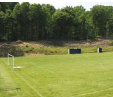
Športno rekreacijski center v Kadrencih

Športno rekreacijski center Kadrenci, Kadrenci