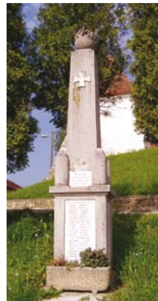
Spomenik padlim v 1. svetovni vojni