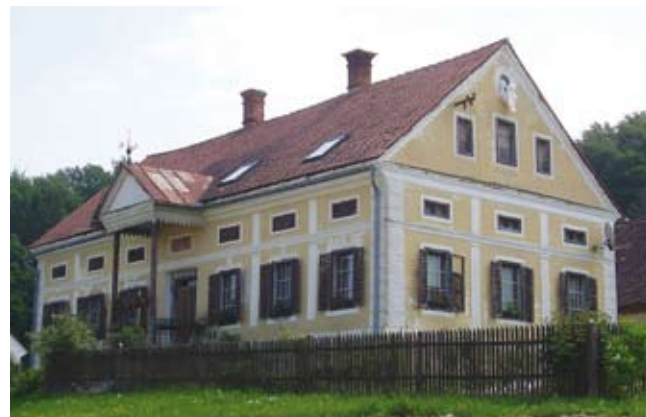
Kmečka hiša Plojevih v Brengovi

pokopa je še danes neznanka, saj naj bi bil skrivno pokopan prav nekje v Slovenskih goricah, z vsem svojim bogastvom. O njegovem zakladu so se spletle številne zgodbe in nekateri so ga že v preteklosti poskušali odkriti. Tudi za naš kraj so trdili, da je Atila pokopan v Šulcovem gaju ali še kje drugje.