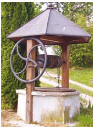
Vodnjak v Andrencih

se že kaže kot renesančen. Kužno znamenje v Čagoni je bilo postavljeno leta 1641 in se uvršča med pozno-baročna znamenja.