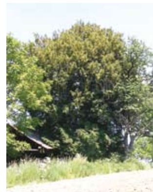
Mogočna Tisa na Čolnikovem bregu