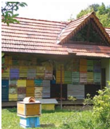
Čebelnjak Hauzerjevih v Cogetincih