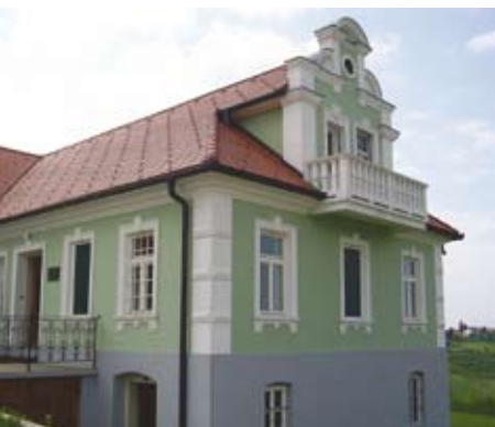
Tušakova vila z muzejsko zbirko