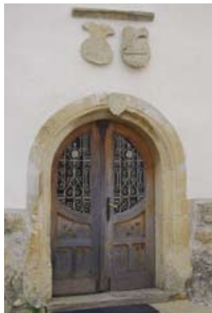
Vhodni portal v cerkev Sv. Antona, z grboma mesarskega in klobučarskega čeha, ki sta podprla gradnjo cerkve

Na težke čase v začetku 20. stoletja opozarja spomenik padlim vojakom v 1. svetovni vojni pri cerkvi, ko so se tudi Cerkvjenjačani za Avstro-Ogrsko monarhijo borili in padali od Soške fronte do Rusije. Nekateri med njimi so se ob koncu