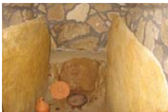
Notranjost gomile št. XIV v Anželovem gozdu v Brengovi

V večini so bile rimske gomile prekopane že pred več kot sto leti in tudi kasneje, vendar so kot kulturni spomenik, še posebej grobnice v njih, izrednega pomena za arheološko študijsko obdelavo.