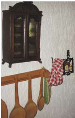
Del »Kühne« v cimprani hiši v Peščenem Vrhu

Delavci so pri kmetu ob sedmih zjutraj dobili zajtrk, ponavadi žgenke, kislo žüpo in šnops. Za južno, ki je bila ob desetih, se je postreglo s kruhom, lükom in kuklo. Obed je bil ob enih. Ponavadi so jedli nüdlčovo žüpo, kuhano meso iz tüje, šelato, včasih tudi pražen krompir. Ob štirih je bila popoldanska južna – kruh in kukla. Za večerjo se je običajno jedla krompirjeva žüpa in šelata. Ob glavnih obrokih so delavci dobili še kvasenice, na košnjah in na preši pa tudi gibanice.