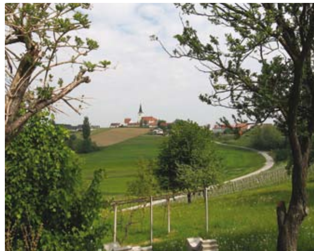
Pogled na Cerkvenjak