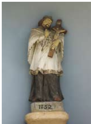
Sv. Janez Nepomuk

oblik. Najpreprostejša oblika je žgani grob na nekdanji površini, kjer so bile sežgane kosti s pepelom in pridatki razsuti na površini enega kvadratnega metra. Redkejši so grobovi s kamnito oblogo, kjer so bili ostanki s kurišča skupaj s sežganimi kostmi in pridatki položeni na tla in nato obdani z večjimi kamniti ploščami. Še redkejša je oblika, kjer so bile v gomilah kamnite žare s pepelom pokojnika ter pridatki.