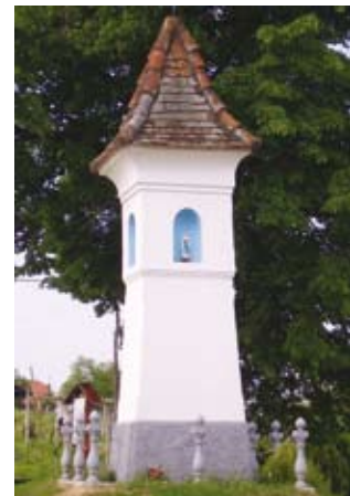
Kužno znamenje v Čagoni

V 15. 16. in 17. stoletju je v teh krajih večkrat razhajala kuga ali »črna smrt«. Kugo so v te kraje prinesli potujoči obrtniki, trgovci in vojaki. Še danes sta ohranjeni kužni znamenji v Cogetincih in Čagoni. Takšna znamenja so postavljali na mestih, kjer so pokopavali ljudi umrle za kugo, to pa je bilo ločeno od pokopališča pri cerkvi. Kužno znamenje v Cogetincih ima letnico 1529. Celota je izrazito gotska, ogalni stebriček pa