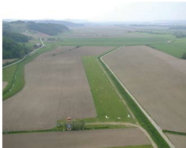
Športno in modelarsko vzletišče Cerkevjak

Kolesarsko potovanje lahko pričnete v Mariboru. Pri Malečniškem mostu prečkate Dravo in pot nadaljujete ob levem bregu stare struge skozi Malečnik in Trčovo proti Zgornjemu Dupleku, kjer zavijete proti Koreni. Od cerkve sv. Barbare (Korena) je prekrasen pogled na Dravsko polje vse do Boča in Donačke gore. Pot nadaljujete mimo vinotočev in turističnih kmetij do Zavrha, kjer si lahko ogledate spominsko sobo Rudolfa Maistra, se okrepcate in povzpnete na Maistrov stolp, s katerega je najlepši pogled na Slovenske gorice. Pot nadaljujete do Lenarta, nato pa se po regionalni cesti spustite mimo umetnega jezera Radehova proti Sveti Trojici. V Komarnici nas pot vodi v Cerkevjak, potem pa naravnost proti Cogetincem in Spodnjim Ivanjcem. Pot je razgibana in poteka po lokalni asfaltirani cesti. Nadaljujete mimo Spodnjih Ivanjcev čez Ščavniško dolino preko Radgonsko - Kapelskih goric do Gornje Radgone ob reki Muri, na meji z Avstrijo.