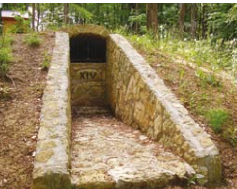
Rimska gomila št. XIV