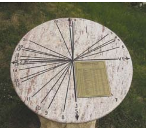
Orientacijski kamen na razglednem mestu pri gasilskem domu

travniki ter sadovnjak do ribnika. Pot se nadaljuje proti Cogetincem in sicer mimo vodnjaka z lesenim kolesom, cimprane hiše in kapele pri Granati proti rimskim gomilam v Grabonoškem Vrhu in nato skozi Peščeni Vrh v Andrece k »lubi vodici« – izviru čiste naravne vode ob