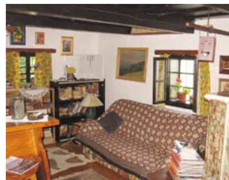
Notranost cimprane hiše v Peščenem Vrhju

Moška oblačila so bila koler in šmizl, prednji del srajce, ki se je za lepši videz nosil prek navadne srajce. Perkli so bili dodatek pri rokavu. Hlače so bile iz domačega hodnega platna ali kupljenega blaga (žamet, kongam).