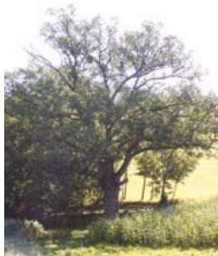
400 let star hrast v Župetincih