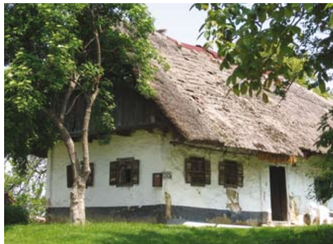
Cimprana hiša v Cogetincih

V občini Cerkvjenjak še stoji več značilnih cimpranih hiš in sicer v Čagoni, Cogetincih in Peščenem Vrhju. V občini zasledimo dve vrsti cimpranih hiš: večje, v katerih so ljudje stanovali, in manjše, ki so bile ob vinogradih. Slednjim so rekli »vrh«, kar verjetno izvira iz tega, da so stale na vrhovih gričev in vinogradov. V njih so živeli »vencarji« - viničarji, ki so namesto najemnine morali obdelovati vinograd. Gospodarski del hiše je večinoma lesen, sprednji bivalni pa je cimpran, z leseno konstrukcijo iz tramov. Oblečen je v glinast omet in prebeljen z apnenim beležem, ki je spodaj zaradi kokoši pobarvan sivo. Strehe so