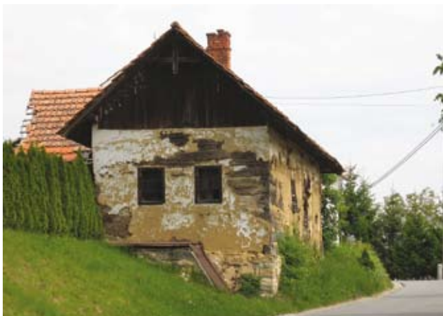
Cimprana hiša v Cerkvjenjaku

dokumentu iz leta 1491, ki ga ta ohlapno locira k Ljutomeru.