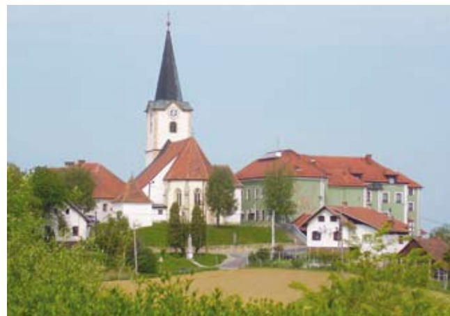
Cerkev sv. Antona spomladi

Prvotna cerkev je bila morda zgrajena že v 13. stoletju, vsekakor pa pred letom 1399, ko se omenja vas, ki je po cerkvi dobila ime. Cerkev so v zadnjih dveh desetletjih 14. stoletja gotizirali. Med letoma 1395 in 1400 sta severno, zahodno in južno steno ladje poslikala dva slikarja. Naslikani prizori so razvrščeni v tri horizontalne pasove, med seboj ločene z dekorativnimi obrobami. Dekorativne prvine poslikave kažejo na neposredne povezave z gornještajersko »vojvodsko delavnico«. V zgornjem horizontalnem pasu so upodobljeni pasijonski prizori: Križanje, Polaganje v grob in Vstajenje, v srednjem pasu je velika kompozicija Pohoda in Poklona sv. Treh kraljev, na spodnjem pasu so prizori težko prepoznavni, saj je fragmentarno ohranjen. Sedanja prevladujočo poznogotsko podobo je cerkev dobila med letoma 1516 in 1546. Nad portalom je letnica 1516MT, v ladji pa letnica 1563. Opazni so slogovni vplivi cerkve sv. Lenarta v Lenartu. Leta 1825 so prezidali zakri-