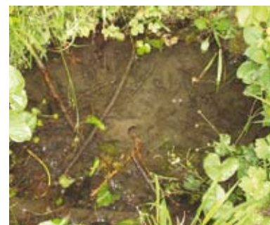
Izvir Lübe vodice

V Andrencih je že od nekdaj izvir vode, ki ni presahnil niti v največjih sušah, ko je povsod drugod vode že zmanjkovalo. Ko so ljudje prihajali tja po vodo, so rekli »lüba vodica«. Po tem je izvir dobil ime, ki se je ohranilo vse do danes, pa tudi naselje je nekoč nastalo prav zaradi