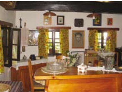
»Predna hiša« cimprane hiše v Peščenem Vrhju

je plod uporabnikove potrebe, možnosti prostora in okolja. Grajena je bila z domačimi materiali in preprostim orodjem - v Slovenskih goricah predvsem z leseno konstrukcijo in zatesnjeno z glinastim ometom ter prebeljeno z apnom. Tipičnaslovenskogoriška arhitektura so cimprane hiše.