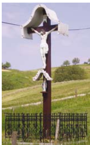
Purgajev križ v Cogetincih

V 5. stoletju so začeli z vzhoda v Panonsko nižino vdirati Huni, ki jih je vodil strašni Atila. O njem so govorili, da kamor stopi, tam trava več ne raste. Njegove horde so vse opustošile in požgale. Toda čeprav so Huni naropali veliko zlata, srebra in dragocenosti, je Atila ostal preprost. Živel je v navadnem šotoru in jedel samo iz lesenih skled. Za zlato in srebro mu ni bilo mar, bolj ga je mikala le oblast. Bil je grozovit vladar, ki ga nihče ni smel zasmehovati. Oprijel se ga je vzdevek Šiba božja. Vsa ljudstva, ki jih je podjarmil, so se morala vojskovati zanj. S svojo vojsko se je odpravil tudi proti Rimu, da bi ga razrušil. Pogumni papež Leon mu je šel naproti in ga odvrnil od njegove namere. Vsi so bili prepričani, da ga bodo Huni pomendrali, vendar se je Atila obrnil in zapustil Italijo. Rim je bil tako rešen. Kmalu po tem, na dan svoje poroke z neko germansko princeso leta 453, je Atila umrl. Mesto njegovega