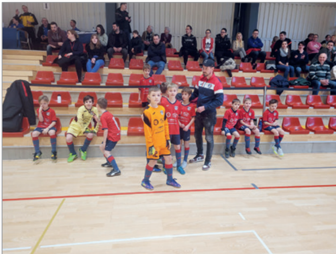
Na turnirju v Dupleku