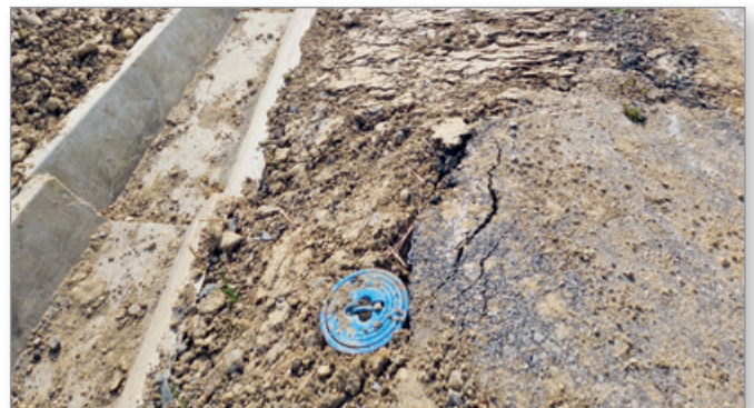
Območje obnove vodovoda in sočasne izgradnje optike – odsek Rajh

Občina Cerkvenjak aktivno in prednostno izvaja aktivnosti za izgradnjo optičnega omrežja po celotni občini in sodeluje ter spodbuja podjetje TELEKOM Slovenije, ki letos načrtuje na območju Občine Cerkvenjak vzpostaviti čim več novega širokopasovnega optičnega omrežja.