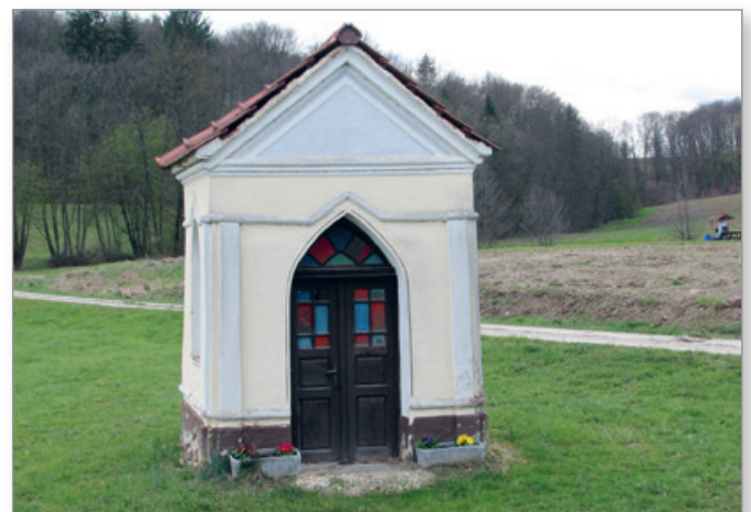
Kapela v Stanetincih, ki kliče po obnovi