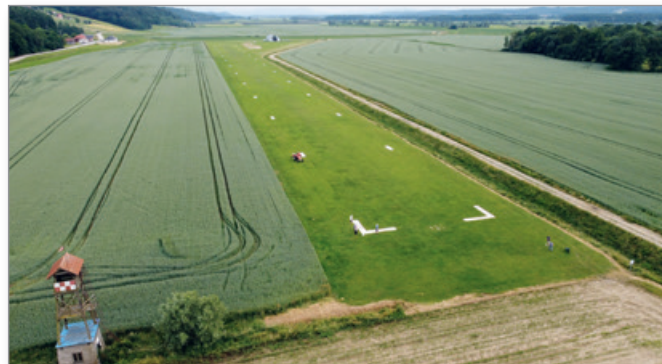
Delovna akcija na vzletišču panorama

Cilj kluba za v prihodnje je predvsem zagotavljati najboljše možne pogoje za varno letenje tako za motorne pilote, modelarje kot motorne padalce. Prav tako želimo še naprej aktivno sodelovati z domačimi in tujimi klubi ter delati na približevanju letalskega športa vsem zainteresiranim. Zato vse zainteresirane vabimo, da se nam pridružite v klubu ali vsaj na naših prireditvah.