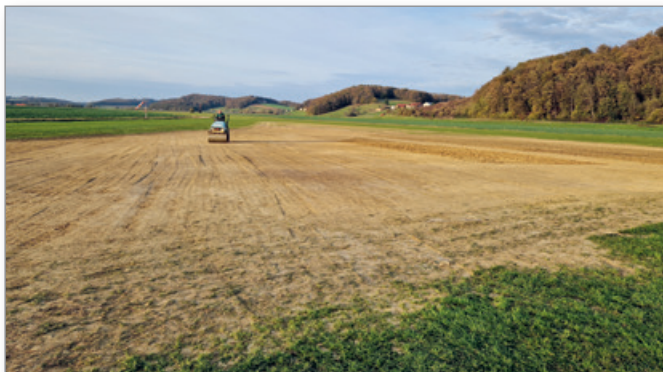
Delovna akcija na vzletišču

Smo stališča, da je treba izkoristiti ta veliki potencial, ki ga nudi samo vzletišče in v prihodnje intenzivno izvajati vse aktivnosti, da bo izvajanje obrambe pred točo iz Cerkvjenjaka ter obisk večjih letal iz tujine kmalu realnost.