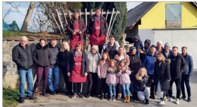
Rez potomke Johanezove trte

V mesecu marcu smo opravili rez potomke Johanezove trte v Peščenem Vrhu in nabrali kresno gobo, ki jo bodo člani na veliko noč nesli v cerkev in nato blagoslovili domove.