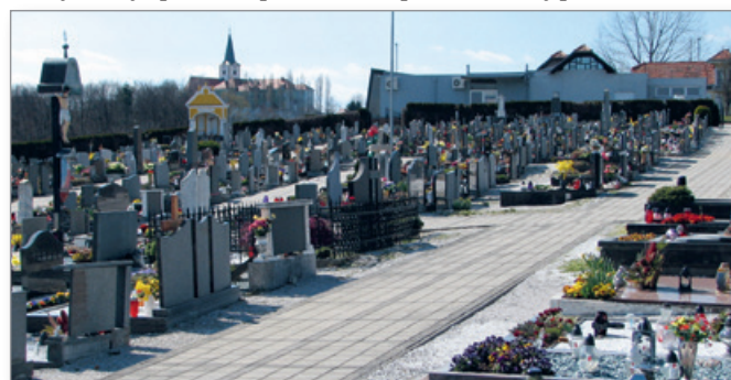
Občina Cerkevnik načrtuje tudi širitve pokopališča in ureditev prostora za raztros pepela.

va, v kateri so prišli do zaključka, da bodo v letu 2023 Ovtarjeve novice še prihajale v poštne nabiralnike cerkvenjaških gospodinjstev. V prihodnje pa se bo videlo, kako in kaj. O glasilu Zrnje iz Cerkevnik so svetniki imeli pohvalno mnenje. Slišati je bilo predlog, da bi bilo boljše k sedanjim štirim izdajam Zrnja letno dodati še eno številko Zrnja namesto Ovtarjevih novic. Svetnike so zmotili tudi nekoliko visoki stroški prevozov šolskih otrok. Opaža se namreč, da šolarji hodijo ponekod peš, avtobus pa vozi skoraj prazen.