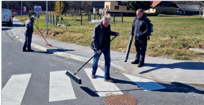
Ekipo režijskega obrata pri čiščenju pločnikov

Občina s svojo ekipo zaposlenih v režijskem obratu ob pomoči zunanjih pogodbenih izvajalcev vzdržuje vse ceste in javne površine. Med glavna opravila po zimski službi, ki jih v režijskem obratu opravijo sami s svojim kadrom in mehanizacijo, je odstranitev peska iz vseh vozniških površin cest ter vse ostalih javnih površin (pločnikov, parkirišč ...).