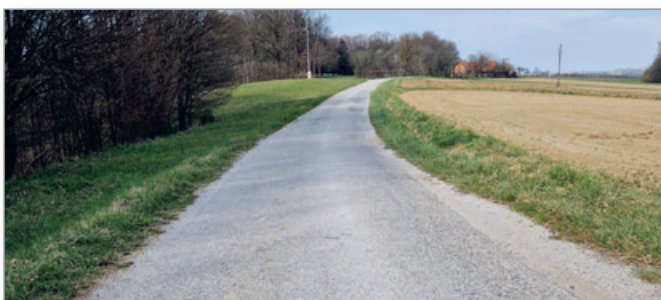
Dotrajan odsek ceste v naselju Komarnica, predviden za sanacijo

Ceste so zaradi tehničnih lastnosti (dotrajanosti in poškodb) slabše prevozne, prometno manj varne ter ne zagotavljajo dobre prometne povezanosti med kraji občine. Prav tako je bilo zaradi dotrajanega vozišča oteženo in drago vzdrževanje teh cest.