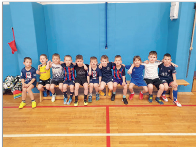
Najmlajši v telovadnici

Po koncu tekmovalnega dela sezone, se je selekcija U7 iz ŠRC preselila v telovadnico osnovne šole. Tam so imeli dvakrat tedensko treninge, trenažni proces pa se je nadaljeval po planu. V zimskem času so tudi odigrali dve prijateljski tekmi proti sovrstnikom iz Jakobskega Dola. V prihodnjih dneh pa se tudi naši najmlajši vračajo na zelenice in pod sončne žarke. Spomladi jih spet čakajo turnirji proti okoliškim ekipam U7.