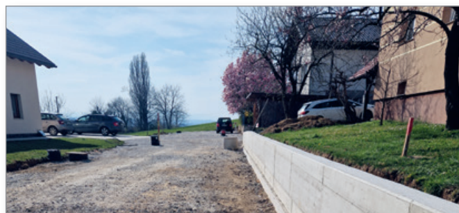
Ureditev komunalne opreme ulice Cerkvjenjak - Govedič

Že od jeseni 2022 se izvaja prva faza celovite komunalne ureditve manjše ulice v naselju Cerkvjenjak, in sicer na odseku Cerkvjenjak – Govedič v dolžini cca 100 m. Projektna dokumentacija je bila izdelana spomladi, gradbeno dovoljenje za poseg je bilo pridobljeno v drugi polovici poletja 2022 in tudi izvajalec del je izbran, ki zaključuje z gradbenimi deli na prvi fazi.