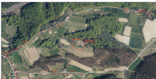
Obnova vodovoda v naselju Cogetinci

Ob tem se je skupaj s podjetjem Telekom izvedla tudi kableska kanalizacija za optično omrežje.