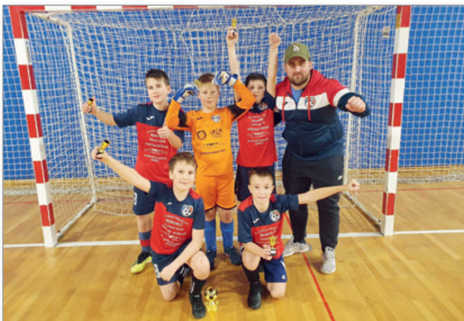
Turnir v Sladkem Vrhu

Prva tekma spomladi jih čaka v soboto, 1. 4. 2023, na domačem igrišču v ŠRC Cerkvenjak.