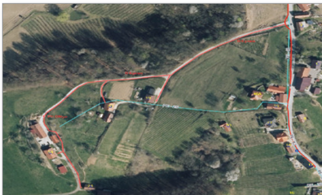
Obnova vodovoda v naselju Cenkova

Občina Cerkvenjak je že v letu 2022 v okviru sočasne gradnje z optičnim omrežjem izvedla tudi projekt I. faze obnove dotrajanega vodovodnega cevovoda starega prek 45 let na odseku od GD Cerkvenjak v smeri naselja Cenkova do območja križišča za Rimsko gomilno grobišče in sicer v dolžini cca. 1 km. Prva faza investicije, ki je obsegala izvedbo glavnega cevovoda brez priključkov, je bila v celoti zaključena že v letu 2022. V letošnjem letu se nadaljuje izgradnja odsekov na glavni cevovod. Odsek Rajh je že zaključen.