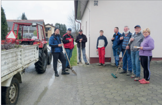
Naš posnetek je iz Andrecev, kjer so »rabotarje« in »rabotarke« pri tako rekoč vsaki hiši, mimo katere so očistili cesto, bogato pogostili.

Rabota je pomembna tudi z ekološkega vidika, saj tisti, ki iz obcestnih jarkov pobira pločevinke od piva in plastenke od sokov, sam zagotovo nesnage ne bo nikoli več metal iz avta skozi okno ob cesto.