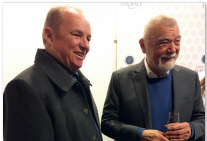
Po končanem uradnem delu okrogle mize je sledilo sproščeno druženje. Sam sem imel priložnost zanimivega in konstruktivnega pogovora s Stjepanom Mesičem.

Moja sklepna misel po končani okrogli mizi je zagotovo, da je k slovenski osamosvojitvi in mednarodni podobi vsak prispeval svoj delež in da bi bilo veliko težje doseči mednarodno priznanje Slovenije brez prizadevanj Slovencev po svetu, ki pa si niti z eno besedo ne pripisujejo nikakršnih zaslug za pomoč in omenjena dejanja ter v večini primerov niso prejeli nobenih priznanj. Niso tako kot nekateri naši politiki, ki so pred tridesetimi leti prejeli zlati častni znak svobode, ga vrnil v plastični vrečki, po tridesetih letih pa zaprosili za vrnitev odlikovanj. Ali kot je dejal Mesič, ne politikov, manjka nam državnikov. Jaz bom dodal, manjka nam takšnih