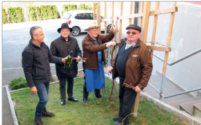
Člani DU Cerkevjak pa so opravili rez svoje potomke Johanezove trte.