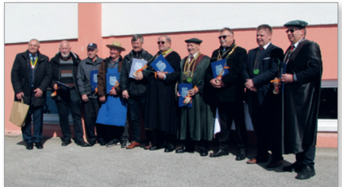
Prejemniki cepičev Johanezove trte