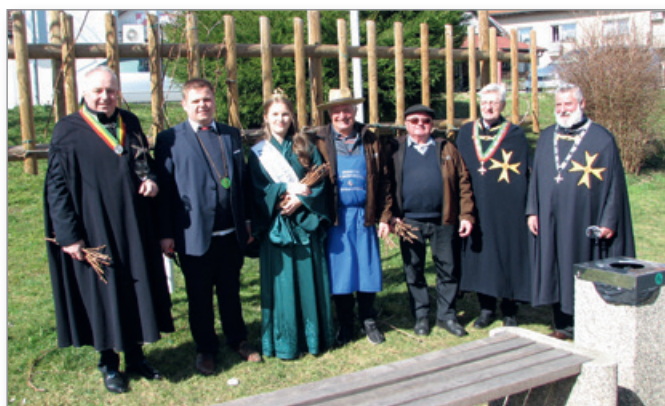
V sklopu rezi je bila opravljena še rez potomke Johanezove trte pri OŠ Cerkevjak – Vitomarci.