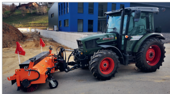
Strojno pometanje cest z lastno mehanizacijo

Na celotnem območju občine jih vsako pomlad čaka čiščenje cca 250.000 m 2 , kar jim je letos uspelo v večji meri že realizirati. V večjem obsegu se da čiščenje izvesti strojno s traktorjem in pometalno napravo, preostanek pa ročno.