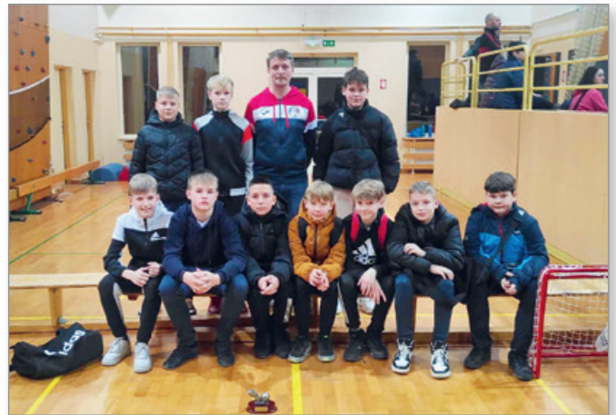
Na turnirju v Bakovcih

Drugi del sezone otvorijo, v soboto, 1. 4. 2023, v Rušah proti NK Pohorje.