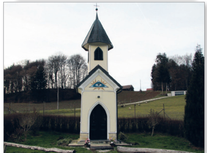
Pred nedavnim obnovljena Kapela v Župetincih