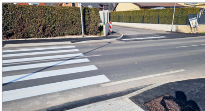
Prehod prek regionalne ceste za novo naselje Cogetinci

Celotna investicija z gradnjo in odkupi zemljišč ter potrebno projektno dokumentacijo bo občino stala več kot 180.000 EUR. Vse to z namenom, da se čim več občanov odloči ostati ali si najde svoj dom v Cerkvjenjaku. V zadnjem obdobju so se z ureditvijo komunalne, šolske, športne, poslovno-trgovske, zdravstvene, kulturne in druge infrastrukture resnično ustvarile razmere za zelo kvalitetno prebivališče, kar se kaže na vsakoletnem zviševanju števila prebivalcev.