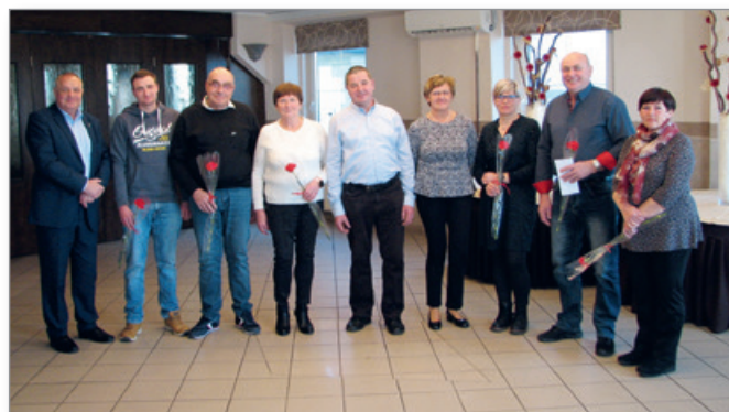
Prejemniki priznanj, kar precej jih manjka, četudi se je zbora RK in srečanja krvodajalcev udeležilo več kot 90 članov te humanitarne organizacije.

vljene naloge v celoti izvedli. Pomagati v težkih trenutkih in krvodajalstvo pa je že tako nekakšna domena Cerkvjenjačanov, in ne samo domena, ampak moralna dolžnost, kajti v Cerkvjenjačanih se razvija čut do sočloveka. Darovati kri pa pomeni darovati del sebe.