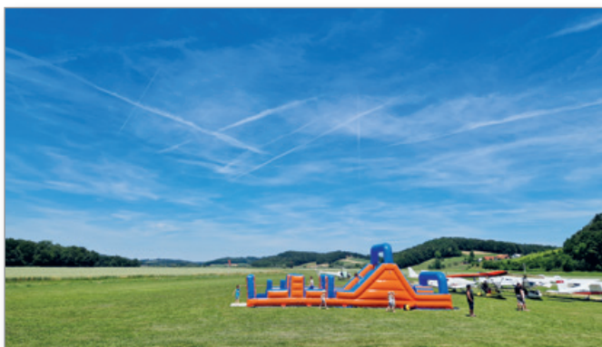
Letalski dan – panoramsko letenje

Na državnem prvenstvu v ULN letenju, ki se ga bomo po načrtu udeležili tudi letos, bomo poskušali ponoviti dobro uvrstitev. Prav tako se nam letos v Cerkvjenjaku obetajo državna tekmovanja v modelarstvu.