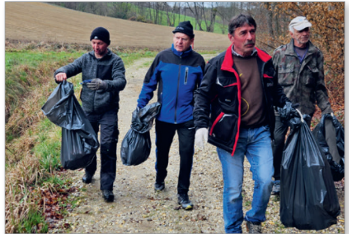
Rabota Društva Krdebač