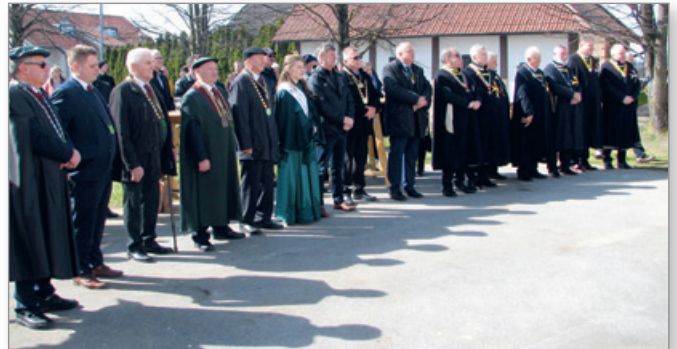
Rezi so se tudi tokrat udeležili številni vinski vitezi Evropskega in Slovenskega reda vitezov vina.

V Cerkevjaku so v nedeljo, 12. marca, opravili že 19. rez Johanezove trte, potomke najstarejše trte na svetu z mariborskega Lenta. Hkrati sta bili opravljeni še rezi Johanezove potomke pri OŠ Cerkevjak – Vitomarci in pri domovanju DU Cerkevjak. Dogodka so se kot običajno udeležili številni vitezi Evropskega in Slovenskega reda vitezov vina.