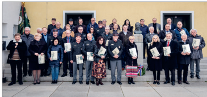
Prejemniki priznanj ZDGM za leto 2023 pred Štupičevo vilo na Zavrhu.

so prispevali naši cerkvenjaški fantje in moške, ki so se borili pod poveljstvom generala Rudolfa Maistra.