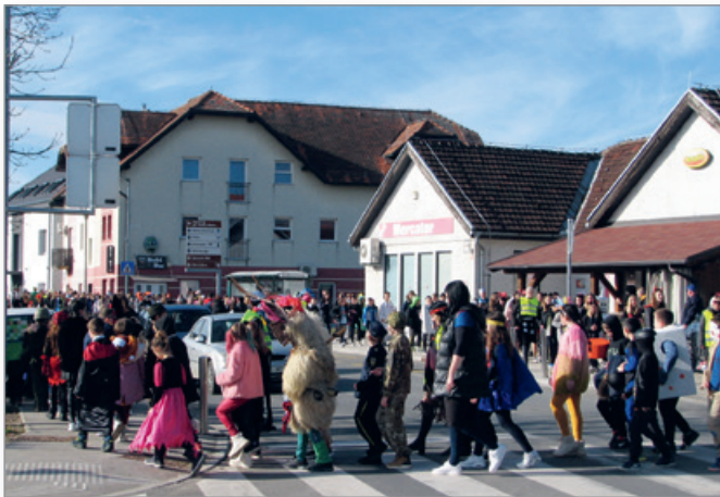
Šolska pustna povorka

Osnovnošolci pa so za pusta pripravili povorko skozi središče Cerkevjak. Lepo je, da se stari običaji, ki so ljudi povezovali, zopet vračajo.