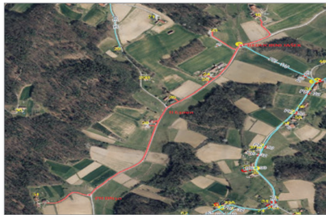
Obnova vodovoda v naselju Župetinci

V prihodnje nas čaka še kar nekaj obnov vodovodnega omrežja, ki je ali dotrajano javno ali staro omrežje vaškega vodovoda. Načrtujemo, da bomo v prihodnjih letih na nak način v naseljih Župetinci (Brezovjak), Grabonoški Vrh in Ivanjski Vrh, v skladu z razpoložljivimi investicijskimi sredstvi sočasno z obnovo vodovoda, izgradili tudi optično omrežje ter hkrati obnovili tudi cesto.