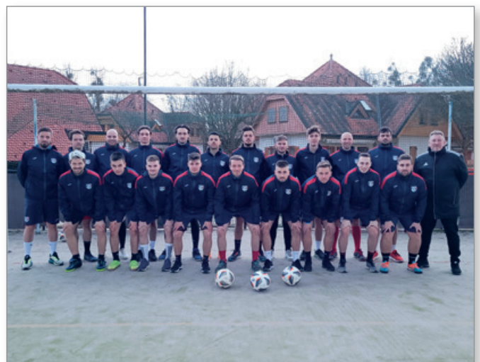
Člani na pripravah

Prvi spomladanski krog naše fante čaka v nedeljo, 2. 4. 2023, ko bodo gostovali v Slivnici pri Mariboru in se pomerili proti ŠD Slivnica.