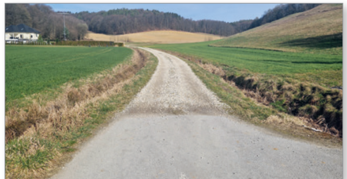
Odsek ceste v naselju Brengova predviden za modernizacijo

Tudi v letu 2023 se tako načrtujejo nove investicije v cestno infrastrukturo in skupaj z občani se veselimo novih pridobitev v prihodnje.