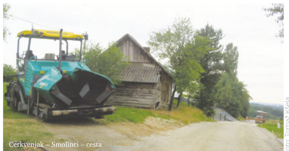
Cerkevnik – Smolinci – cesta

vzdrževanje, ki je bilo doslej zaradi poškodb na cestišču oteženo. Kakovostne ceste prispevajo tudi k hitrejšemu razvoju krajev in boljši povezanosti prebivalstva z občinskimi središči.