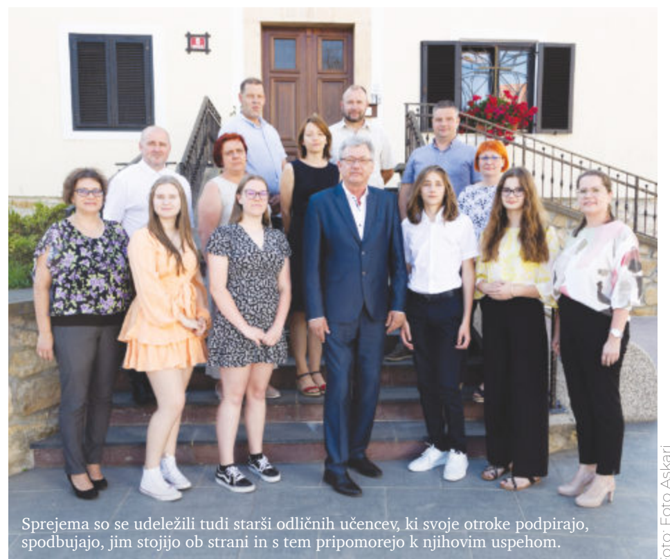
Sprejema so se udeležili tudi starši odličnih učencev, ki svoje otroke podpirajo, spodbujajo, jim stojijo ob strani in s tem pripomorejo k njihovim uspehom.

Vsi učenci so v spomin na zaključek šolanja poleg čestitk in dobrih želja za nadaljnje šolanje prejeli tudi spominsko darilo.