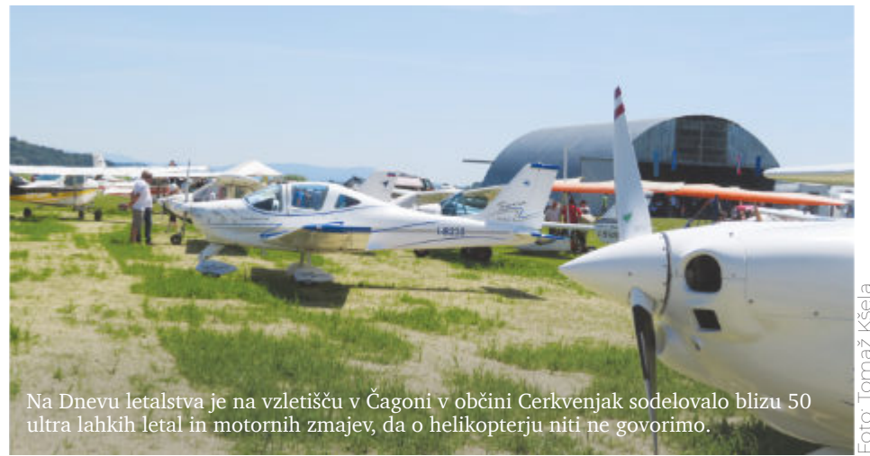
Na Dnevu letalstva je na vzletišču v Čagoni v občini Cerkevnik sodelovalo blizu 50 ultra lahkih letal in motornih zmajev, da o helikopterju niti ne govorimo.

Svojevrsten pečat Dnevu letalstva so dali tudi jekleni konjički, s katerimi so se na ta