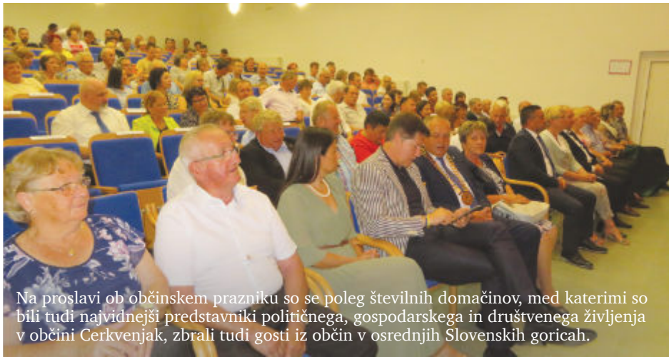
Na proslavi ob občinskem prazniku so se poleg številnih domačinov, med katerimi so bili tudi najvidnejši predstavniki političnega, gospodarskega in društvenega življenja v občini Cerkevjak, zbrali tudi gosti iz občin v osrednjih Slovenskih goricah.