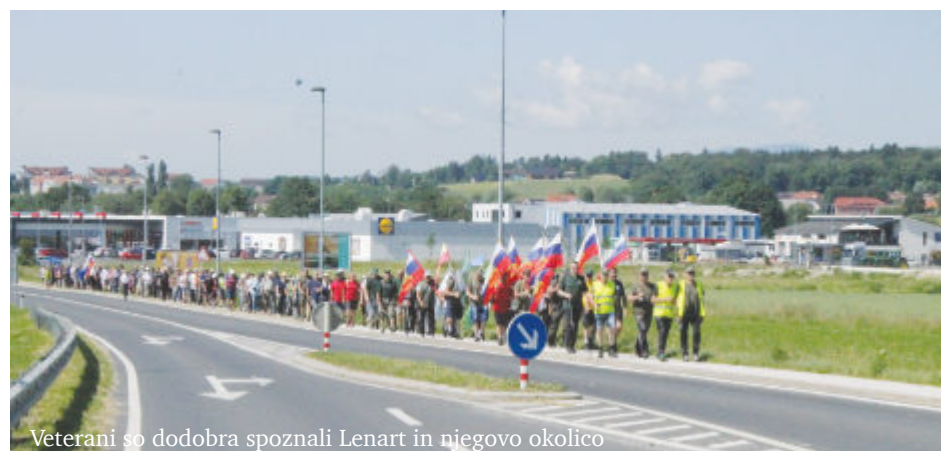
Veterani so dodobra spoznali Lenart in njegovo okolico

naporna. Pohodniki so uživali v lepotah osrednjih Slovenskih goric, saj so se sprehodili med travniki, polji in sadovnjaki, spoznali so ostanke vaške arhitekture ter lep del poti opravili po mestu Lenart in njegovem obrobju. Pohod so končali v ŠRC Polena, kjer so jim organizatorji postregli z izvirnimi slovenskogoriškimi kulinarnimi dobrotami in domačimi vini iz osrednjih Slovenskih goric. Maistrov pohod je že 22 let izjemno priljubljena oblika druženja slovenskih veteranov osamosvojitvene vojne in priložnost za obujanje spominov na čas slovenskega osamosvajanja. Pohod je hkrati namenjen tudi negovanju spomina na generala Rudolfa Maistra. OZ VVS Lenart organizira vsako leto pohod v drugi občini, letos je bila gostiteljica Občina Lenart. Predstavniki veteranskih združenj so se v okviru pohoda s prapori poklonil spomenu braniteljem domovine pri spominskem obeležju v Mestnem parku dr. Jožeta Pučnika v Lenartu.