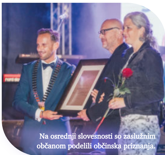
Na osrednji slovesnosti so zaslužnim občanom podelili občinska priznanja.