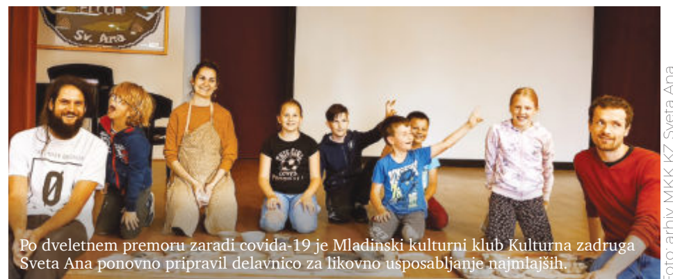
Po dveletnem premoru zaradi covid-19 je Mladinski kulturni klub Kulturna zadruga Sveta Ana ponovno pripravil delavnico za likovno usposabljanje najmlajših.

Anina paletka se je odvijala v sodelovanju z občino Sveta Ana, v operaciji: Miniaturna vasica v Parku generacij Sveta Ana.