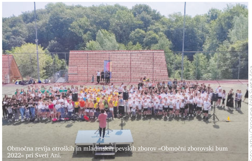
Območna revija otroških in mladinskih pevskih zborov »Območni zborovski bum 2022« pri Sveti Ani.