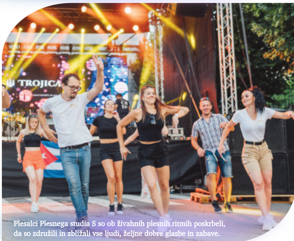
Plesalci Plesnega studia S so ob živahnih plesnih ritmih poskrbeli, da so združili in zbližali vse ljudi, željne dobre glasbe in zabave.