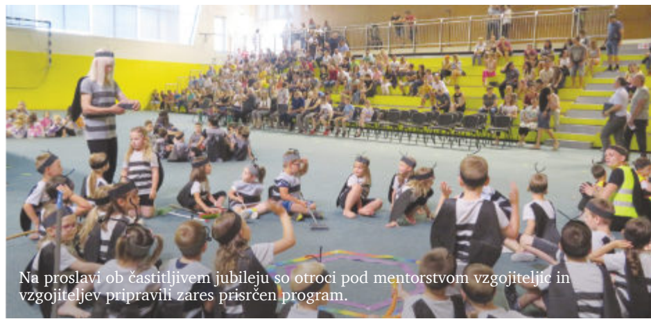
Na proslavi ob častitljivem jubileju so otroci pod mentorstvom vzgojiteljic in vzgojiteljev pripravili zares prisrčen program.