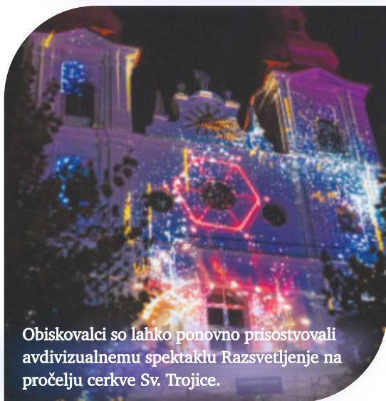
Obiskovalci so lahko ponovno prisostvovali avdivizualnemu spektaklu Razsvetljenje na pročelju cerkve Sv. Trojice.