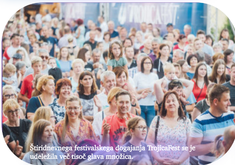
Štiridnevnega festivalskega dogajanja TrojicaFest se je udeležila več tisoč glava množica.