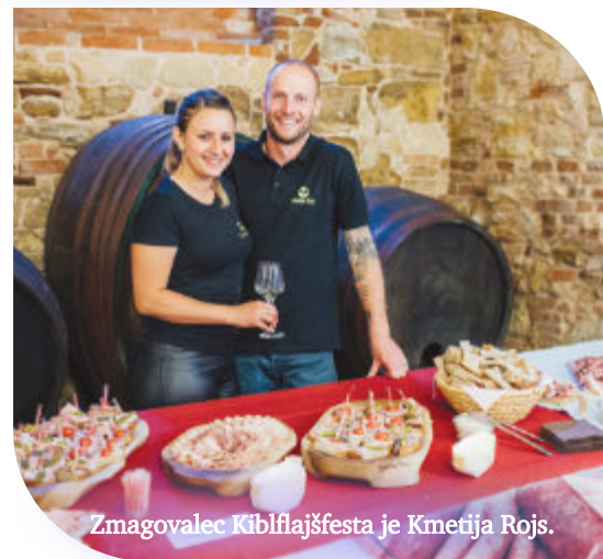
Zmagovalec Kibflajšfesta je Kmetija Rojs.