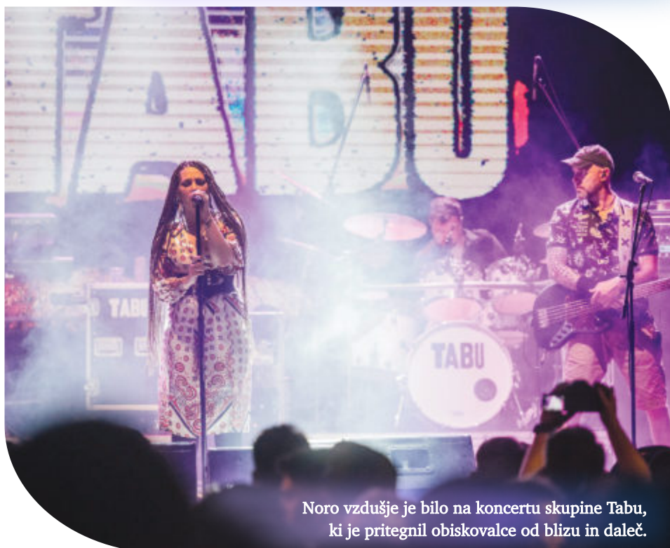
Noro vzdušje je bilo na koncertu skupine Tabu, ki je pritegnil obiskovalce od blizu in daleč.