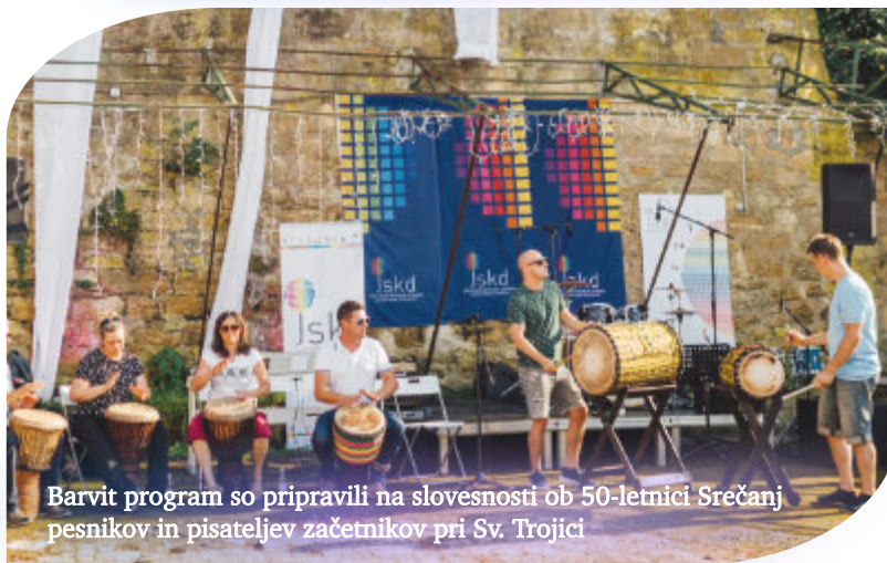
Barvit program so pripravili na slovesnosti ob 50-letnici Srečanj pesnikov in pisateljev začetnikov pri Sv. Trojici