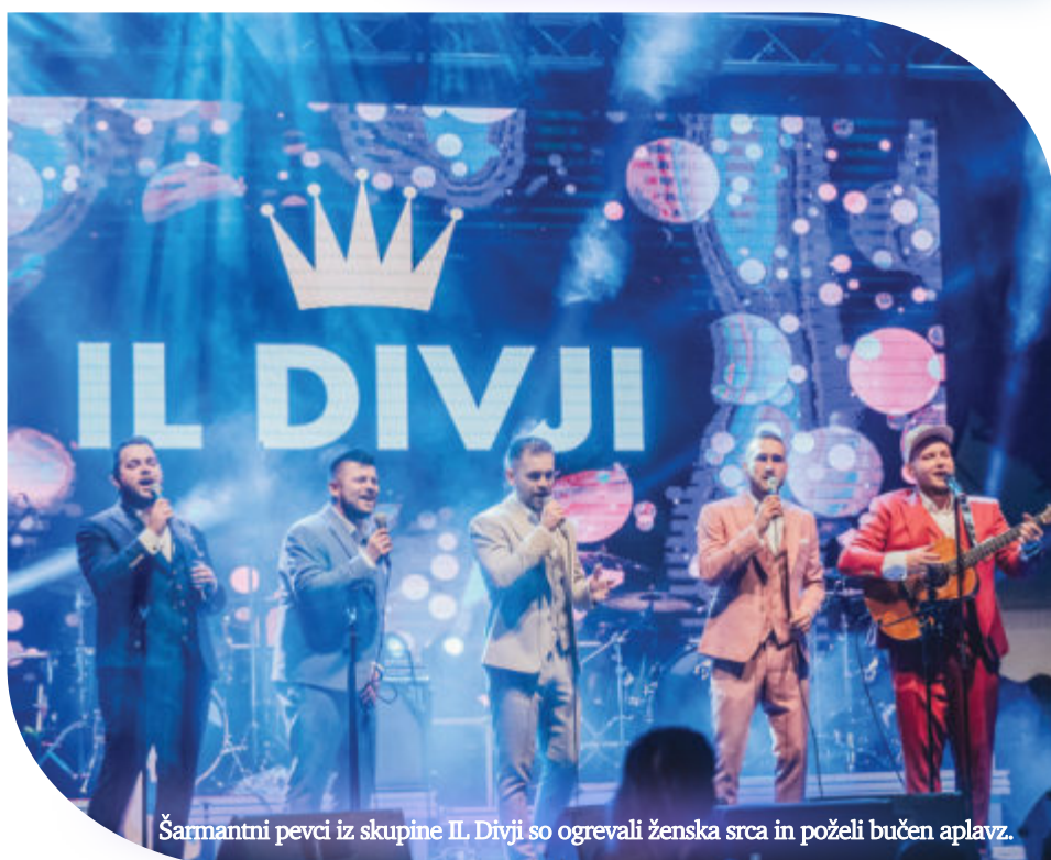
Šarmantni pevci iz skupine IL Divji so ogrevali ženska srca in poželi bučen aplavz.