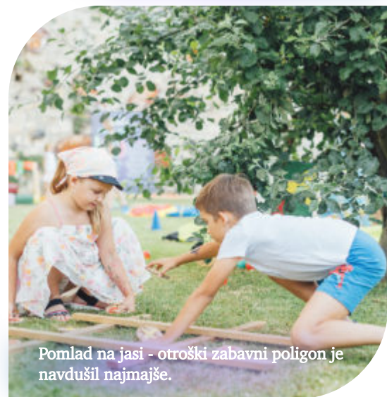
Pomlad na jasi - otroški zabavni poligon je navdušil najmlajše.