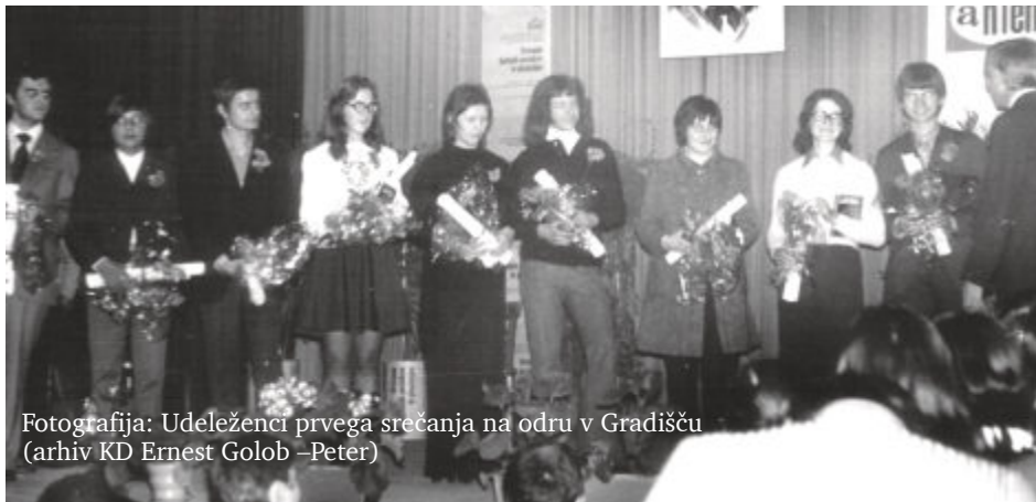
Fotografija: Udeleženci prvega srečanja na odru v Gradišču

Korenine trojiškega literarnega snovanja so preveč globoke, da bi jih lahko izruval še tako močan politično-ideološki vihar. V zgodovino so nekdanja Srečanja pesnikov in pisateljev začetnikov (SPIZ) trajno zapisana kot del vseslovenskega literarnega gibanja. Mnjenja so sicer deljena, a zgodovine za nazaj pač ni mogoče spreminjati. Pobuda je dozorela v ekipi ljudi, ki so vedeli, kaj hočejo, zato so tudi zasluge nedeljive in gredo vsem, ki so dodelali pomen takšne kulturne prireditve pred pol stoletja v nekdanjem Gradišču, ki smo mu sicer domačini vedno rekli kar »Trojica«. Tako je pač bilo.