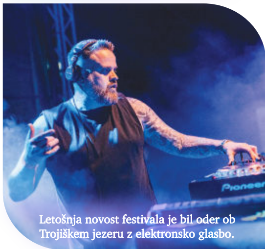
Letošnja novost festivala je bil oder ob Trojiškem jezeru z elektronsko glasbo.