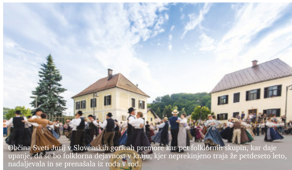
Občina Sveti Jurij v Slovenskih goricah premore kar pet folklornih skupin, kar daje upanje, da se bo folklorna dejavnost v kraju, kjer neprekinjeno traja že petdeseto leto, nadaljevala in se prenašala iz roda v rod.