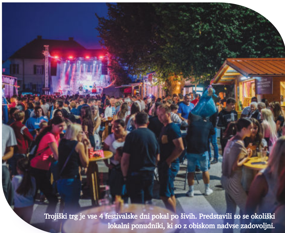
Trojiški trg je vse 4 festivalske dni pokal po živih. Predstavili so se okoliški lokalni ponudniki, ki so z obiskom nadvse zadovoljni.