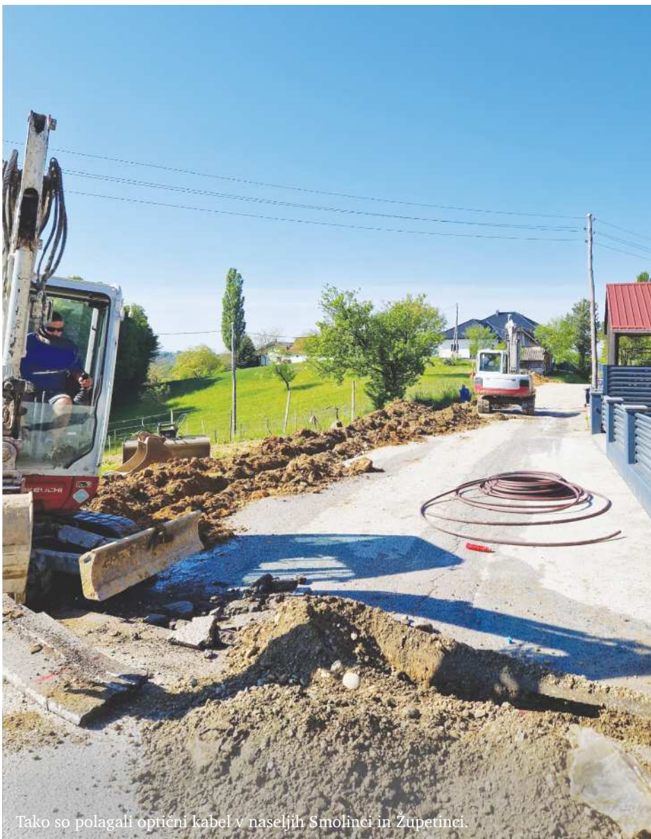
Tako so polagali oprečni kabel v naseljih Smolinci in Župetinci.