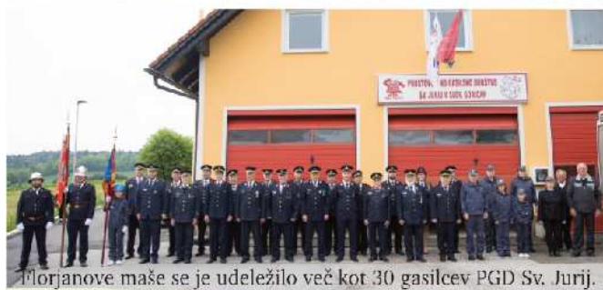
Florjanove maše se je udeležilo več kot 30 gasilcev PGD Sv. Jurij.