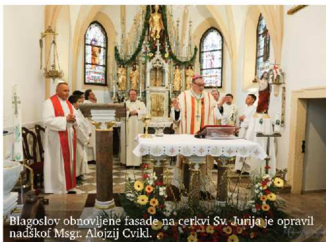
Blagoslov obnovljene fasade na cerkvi Sv. Jurija je opravil nadškof Msgr. Alojzij Cvikel.