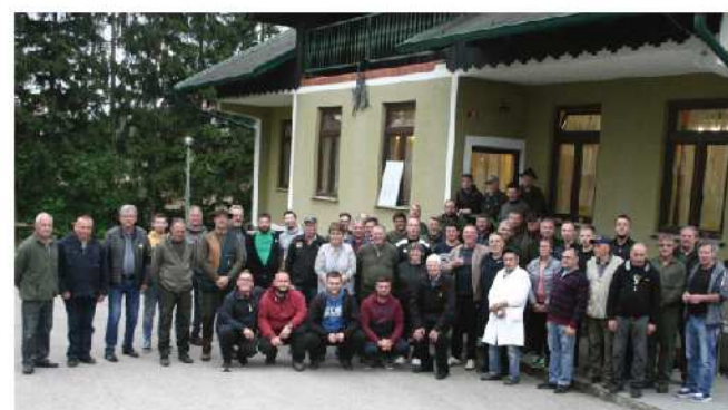
Tradicionalnega srečanja gasilcev in lovcev se je udeležilo več kot 50 članov in se je odvijalo v lovskem domu in v njegovi okolici. Pokal so tudi letos, kot leta 2019, prevzeli lovci.