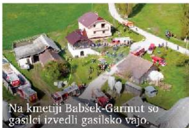
Na kmetiji Babšek-Garnut so gasilci izvedli gasilsko vajo.