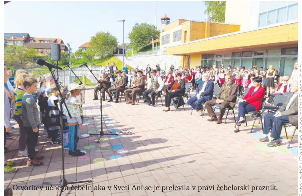
Otvoritev učnega čebelnjaka v Sveti Ani se je prelevila v pravi čebelarški praznik.