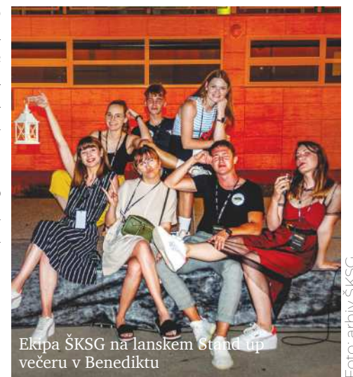
Ekipa ŠKSG na lanskem stand up večeru v Benediktu

Mi že komaj čakamo na poletne projekte, kaj pa vi?