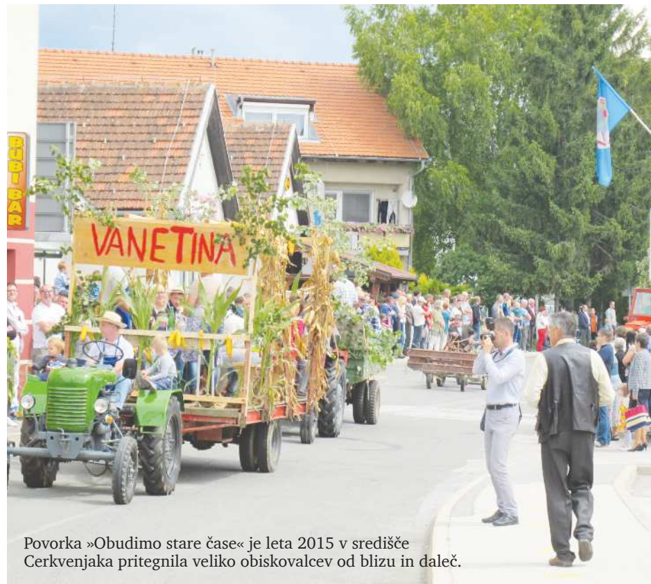
Povorka »Obudimo stare čase« je leta 2015 v središču Cerkevjak pritegnila veliko obiskovalcev od blizu in daleč.

Društvo vinogradnikov in ljubiteljev vina Cerkevjak in Društvo kmečkih deklet in žena bosta tudi letos pripravila večer in razstavo »Vino in kulinarika«, ki vsako leto pritegne številne obiskovalce, ki cenijo domače dobrote. Društvo Krdebač bo pripravilo Rimski tabor pri Lübi vodici, Društvo general Maister pa pohod po severni meji Cerkevjak. Kulturno društvo Cerkevjak bo skupaj z drugimi društvi organiziralo srečanje »Pod lipo samostojnosti« s kulinaricnim pridiom, Športno društvo »Rekreativno kolesarjenje« in Društvo upokojencev »Srečanje ljudskih pevcev«. Poleg tega bo v okviru praznika še več športnih, kulturnih in drugih prireditev, ki se bodo končale s tradicionalno košnjo trave in grabljanjem v organizaciji turističnega društva. Na prireditvah v okviru občinskega praznika občine Cerkevjak lahko vsakdo najde nekaj zase.