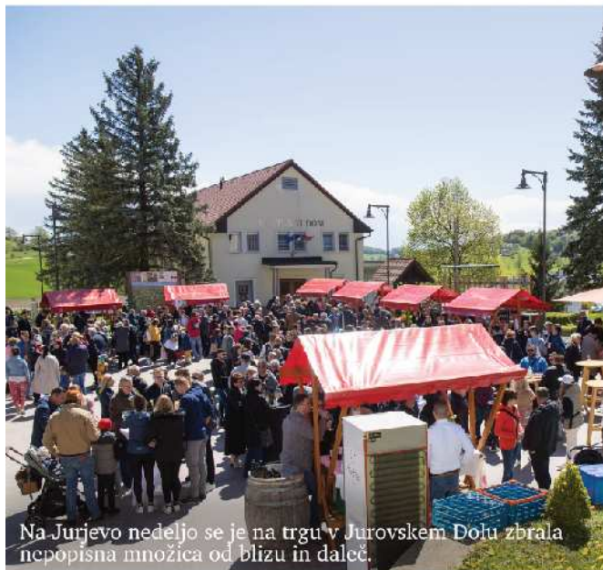
Na Jurjevo nedeljo se je na trgu v Jurovskem Dolu zbrala nepopisna množica od blizu in daleč.