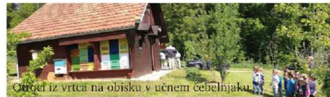
Orgel iz vrta na obisku v učnem čebelnjaku.