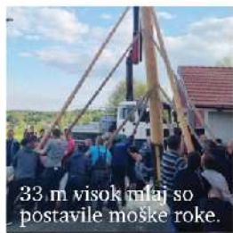
33 m visok mlaj so postavile moške roke.