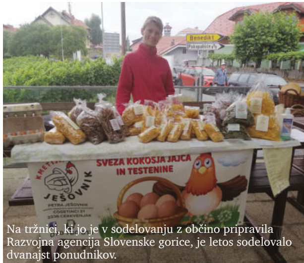
Na tržnici, ki jo je v sodelovanju z občino pripravila Razvojna agencija Slovenske gorice, je letos sodelovalo dvanajst ponudnikov.