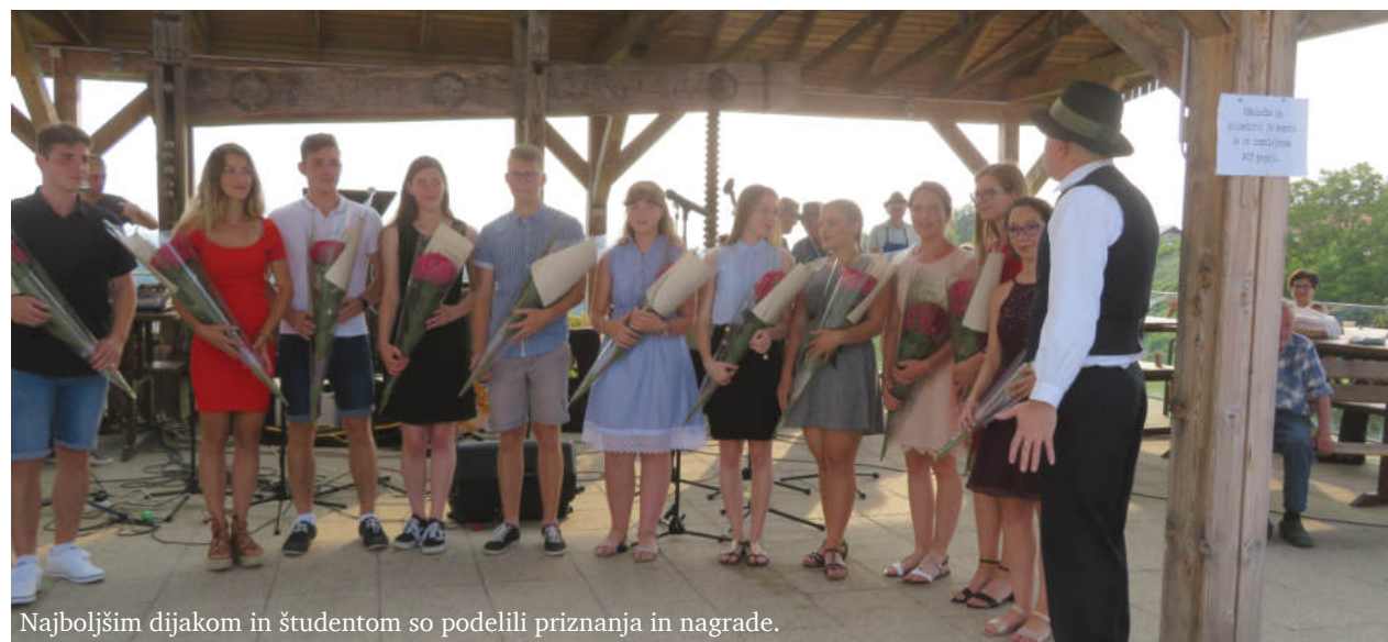
Najboljšim dijakom in študentom so podelili priznanja in nagrade.