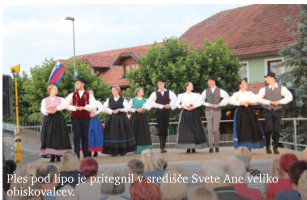
Ples pod lipo je pritegnil v središče Svete Ane veliko obiskovalcev.