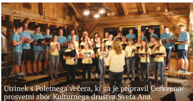
Utrinek s Poletnega večera, ki ga je pripravil Cerkveno-prosvetni zbor Kulturnega društva Sveta Ana.

V programu Aninega tedna ni manjkalo niti športnih prireditev in tekmovanj. Društvo upokojencev Sveta Ana je pripravilo meddruštveno kegljanje s kroglo na vrvi in kolesarjenje po poteh občine, Športno društvo Sveta Ana pa turnirje v ulični košarki, badmintonu, odbojki na mivki, malem nogometu, namiznem tenisu in skipeballu. Športno društvo Jež je pripravilo turnir v namiznem nogometu in kartanju šnopsa, društvo konjenikov Srebrni jezdec pa pohod konjenikov po mejah občine. Več dogodkov so pripravili tudi drugi organizatorji.