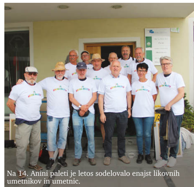
Na 14. Anini paleti je letos sodelovalo enajst likovnih umetnikov in umetnic.