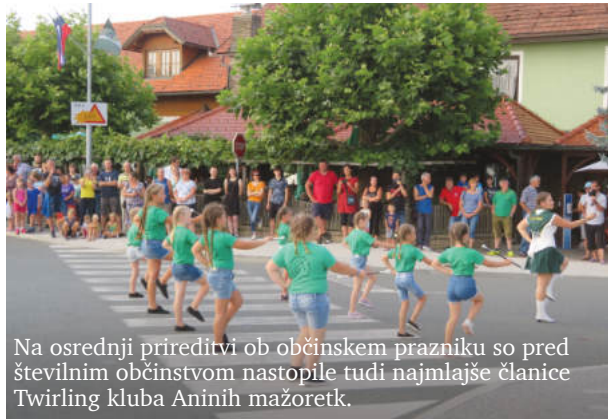
Na osrednji prireditvi ob občinskem prazniku so pred številnim občinstvom nastopile tudi najmlajše članice Twirling kluba Aninih mažoretk.

Kot je dejal Slaček, je občina v poletnih mesecih v številnih zaselkih modernizirala cestne odseke v skupni dolžini okoli treh kilometrov. Razpis za izbiro izvajalcev del so objavili že spomladi, za kar so morali na občini pravočasno pripraviti vso dokumentacijo. Zgradili so tudi prizidek k vrtcu. Pod osnovno šolo zaključujejo urejanje miniaturne vasi, do dneva mrtvih pa bodo izvedli tudi prvo fazo prenove in širitve pokopališča na Sveti Ani, ki ga bodo do konca prenovili prihodnje leto. V Sveti Ani bodo v prihodnje zgradili tudi poslovno-stanovanjski objekt (njegovo maketo so si lahko obiskovalci ogledali v avli občinske zgradbe), v katerega se bo preselila trgovina Mercatorja, v njenih današnjih prostorih pa bo v prihodnje manjša lekarna. Po besedah Slačeka si občina prizadeva tudi za izgradnjo manjše enote doma za starejše s petintridesetimi posteljami, v katerem bi starejši iz občine lahko preživljali jesen življenja v svojem socialnem okolju.