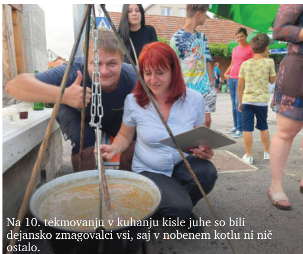
Na 10. tekmovanju v kuhanju kisle juhe so bili dejansko zmagovalci vsi, saj v nobenem kotlu ni nič ostalo.